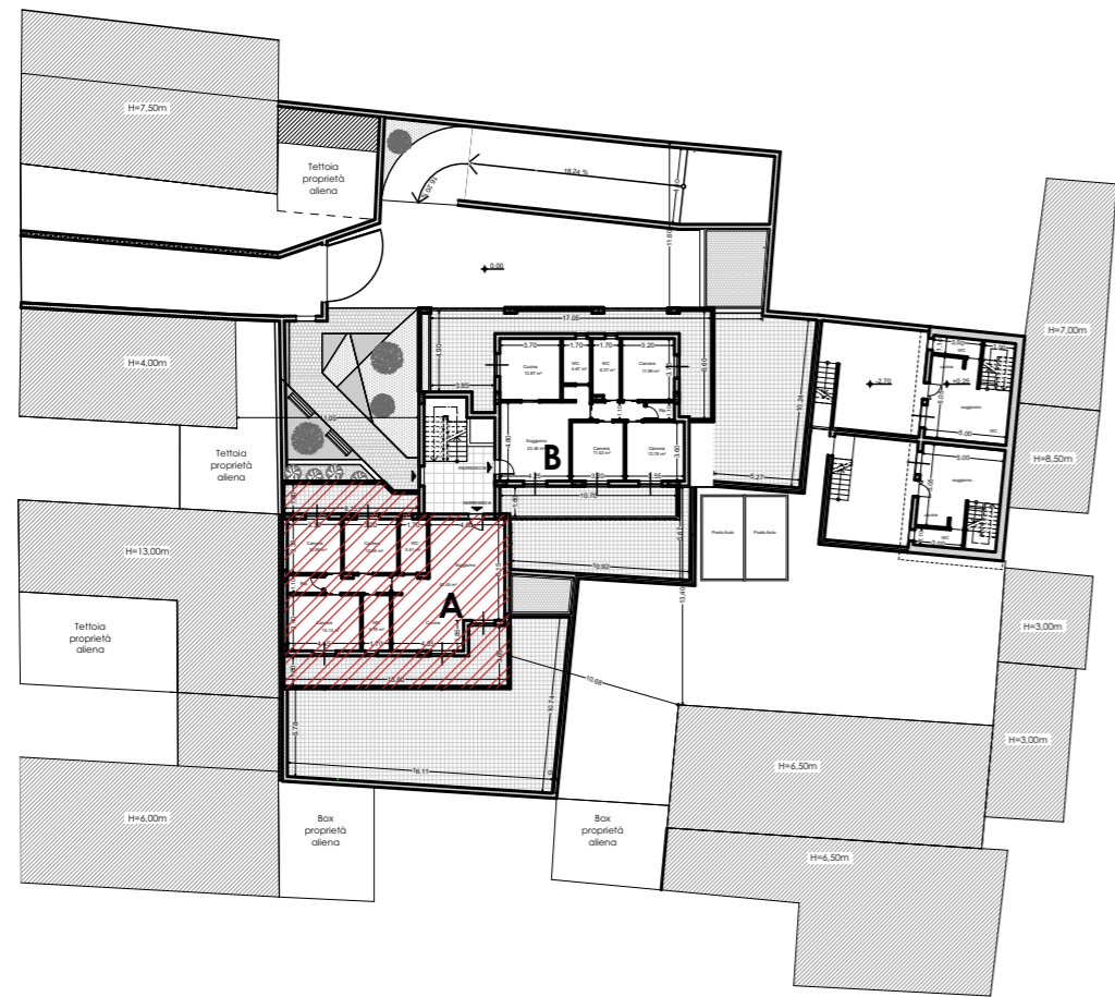
Grafico non vincolante. Il costruttore si riserva la facoltà di apportare eventuali modifiche e/o miglioramenti al progetto

TUTTI I DIRITTI SONO RISERVATI. Questo documento è di proprietà esclusiva di 081architettura architects & partners sul quale si riserva ogni diritto. Pertanto questo documento non può essere copiato, riprodotto, comunicato o divulgato con qualsiasi mezzo od usato in qualsiasi maniera, nemmeno per fini sperimentali, senza autorizzazione scritta di 081architettura architects & partners e su richiesta esso dovrà essere prontamente restituito.